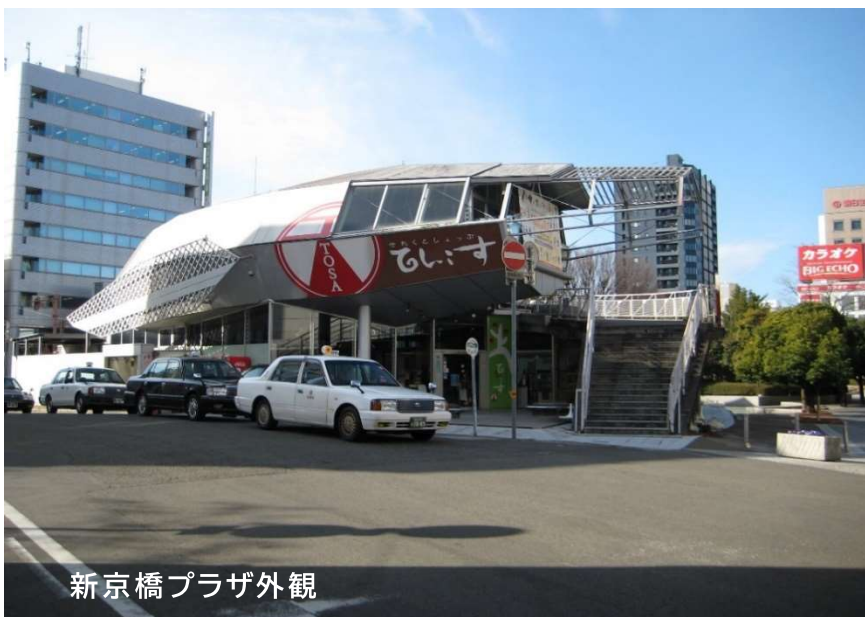
新京橋プラザ外観